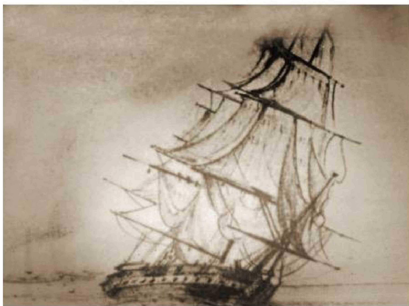
Buque Gulnare en Magallanes (1826).

En 1839 Parker King publica el libro titulado "Relato de los viajes de reconocimiento de los barcos de su Majestad, el HMS Adventure y el HMS Beagle entre los años 1826 a 1836".