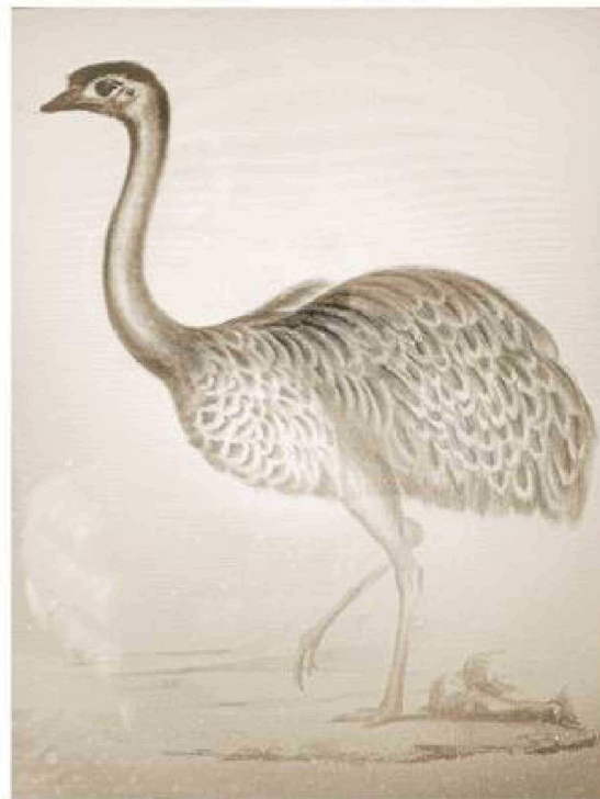
Dibujo de ñandú del profesor Phillip Parker King & Charles Darwin.