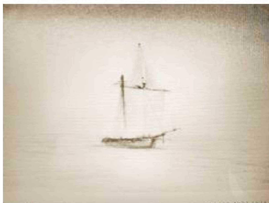
HMS Adventure en Magallanes (1826).

firmamento, pues se extendía frente a nosotros, negruzco y sin brillo, y casi no se le podía distinguir el horizonte, quien ostentaba el mismo color, tan inmensamente distinto de aquel bello océano entre los dos paralelos del trópico, cuya contemplación atrae siempre de nuevo incluso a quien haya viajado mucho con el brillante juego de colores y su expresión de una tranquilidad noble e imperturbable. Las inhóspitas murallas rocosas de la costa se yerguen abruptamente y negras desde el mar, al parecer sin ofrecer en ninguna parte playas sin peligro para desembarcar. Están rodeadas por todas partes por olas que se quiebran y que tienen la altura de la mitad de un mástil. El fondo de este cuadro de la inhospitalidad lo forman montañas elevadas y puntiagudas, que pertenecen a islas más extensas. Todas estaban cubiertas en sus cumbres y en las grietas y hendiduras de sus faldas, hasta muy abajo, con nieve reciente, que se destacaba marcadamente a la roca negra. Entre la perspectiva que ofrecían los canales se elevaban en parte, densas neblinas ascendiendo lentamente e incorporándose a la masa de las oscuras nubes, hasta