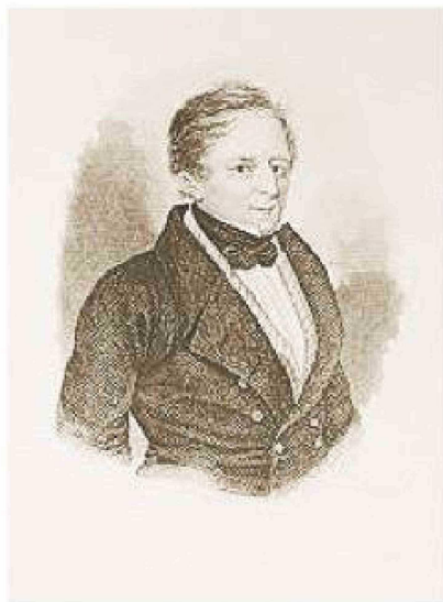
Profesor Eduard Friedrich Poeppig.

Tiraje: 3.000 Lectoría: 9.000 Favorabilidad: No Definida