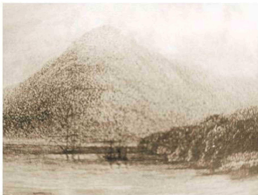
Puerto de Hambre, Punta Arenas, por profesor Parker King.