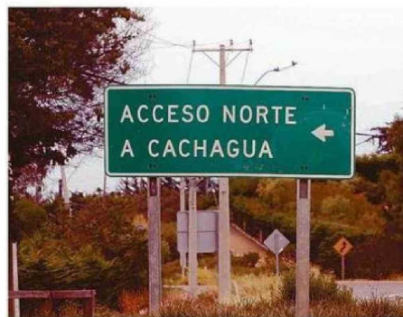
ZAPALLAR Y PAPUDO IMPLEMENTAN MEDIDAS DE TRÁNSITO.

hace ruido al volante. "Moverse a ciertas horas por el litoral costero es terrible. Varios tacos y ni hablar estacionarse: do-