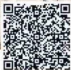
A la vista en el estado que se encuentra