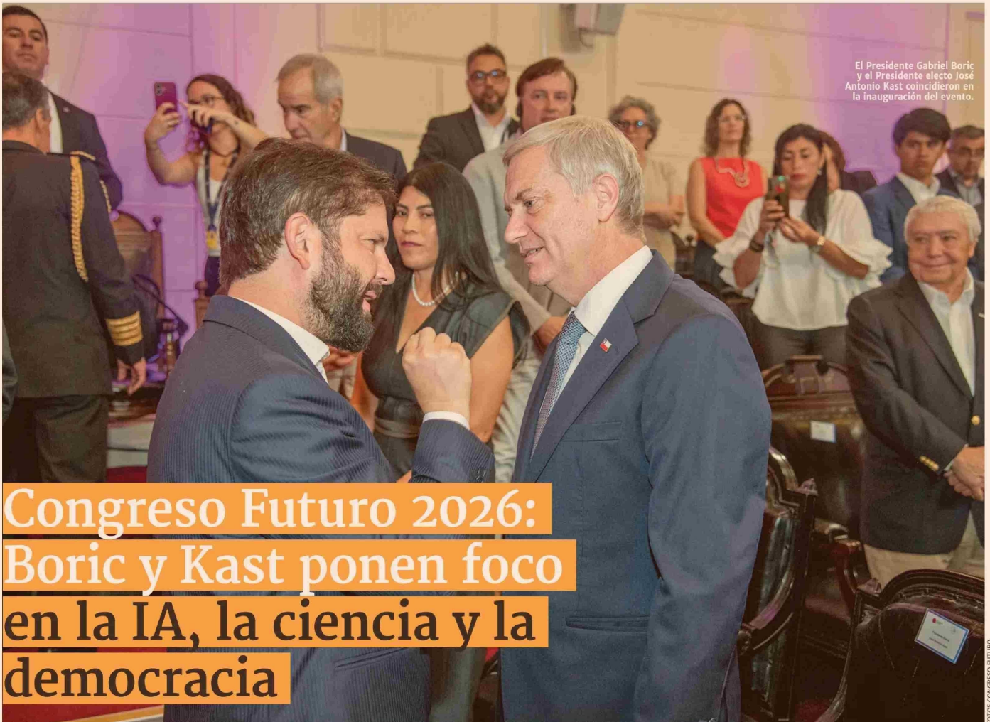
El Presidente Gabriel Boric y el Presidente electo José Antonio Kast coincidieron en la inauguración del evento.

Título: Congreso Futuro 2026: Boric y Kast ponen foco en la IA, la ciencia y la democracia