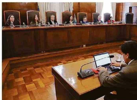
EN LA CORTE PORTEÑA EL TC VIO TRES CAUSAS DE CARÁCTER LOCAL.

JUDICIAL. Tribunal Constitucional sólo lo había hecho previamente en 2014.