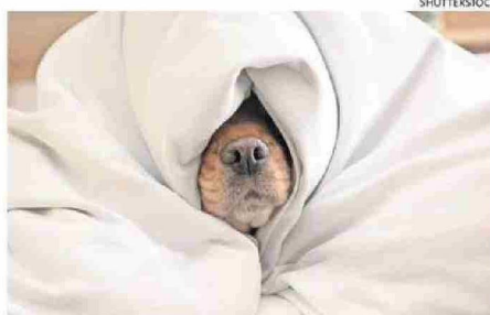
LOS PERROS SE RESFRÍAN Y TIENEN TOS, IGUAL QUE LOS HUMANOS.

Asimismo, en pacientes veterinarios con enfermedades osteoarticulares o aquellas que provocan dolor crónico, y que en oportunidades ya se encuentran medicados, el malestar se ve agravado por las altas presiones atmosféricas que acompañan a las bajas temperaturas.