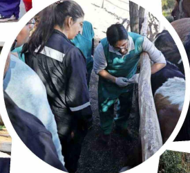
La Medicina Veterinaria es indispensable desarrollarla en terreno.