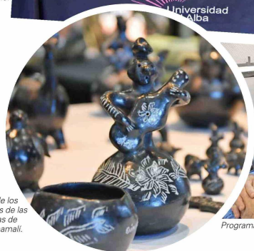
Parte de los trabajos de las alfareras de Quinchamal.