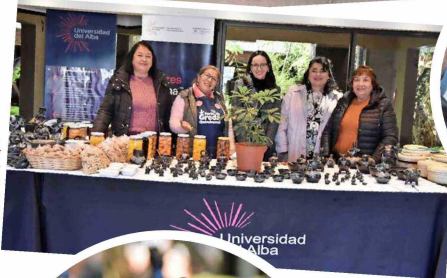
Universidad del Alba