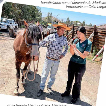
En la Región Metropolitana, Medicina Veterinaria mantiene un convenio con la Municipalidad de Calle Larga.

Presente en Antofagasta, La Serena, Santiago y Chillán, la U. del Alba consolidó una vinculación con el medio centrada en las personas, el aprendizaje con sentido y el aporte concreto a los territorios, integrando docencia, alianzas públicas y trabajo comunitario.