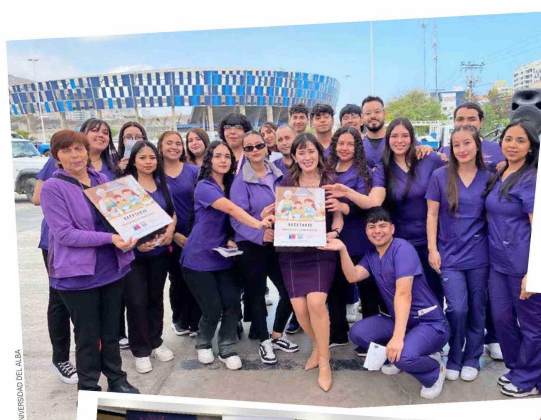
UNIVERSIDAD DEL ALBA

Más de 4 mil estudiantes y 220 docentes participan en iniciativas de Aprendizaje + Servicio (A+S) que articulan formación profesional y aporte directo a los territorios, beneficiando a más de 16.500 personas en distintas zonas del país.