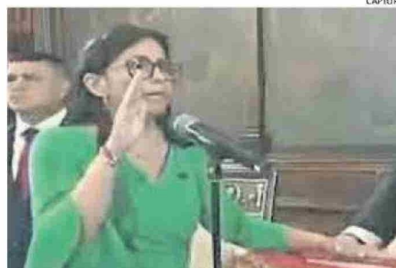
DELICY RODRÍGUEZ JURÓ COMO PRESIDENTA ENCARGADA.