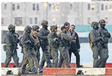
MADURO Y FLORES LLEGARON ESPOSADOS Y VIGILADOS.