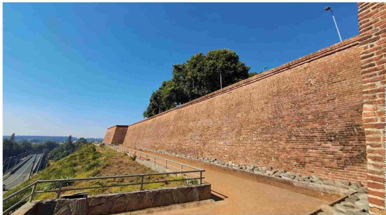
EL FUERTE DE NACIMIENTO celebra 71 años como Monumento Histórico.

El Fuerte de Nacimiento es un emblema de la identidad y el patrimonio de Nacimiento que está celebrando los 71 años desde que fuera declarado Monumento Histórico por el Consejo de Monumentos Nacionales.