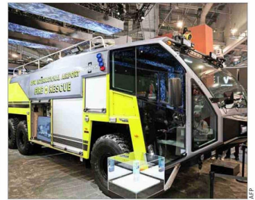
El Oshkosh Striker Volterra es un carro eléctrico de rescate y extinción de incendios ideado para aeropuertos. Es 28% más rápido que uno de diésel.

sensores, en tanto, pueden medir la intensidad de la llama en tiempo real y su cámara entrega una visión al centro de comando de lo que pasa al interior de un recinto en llamas, lo que lo hace ideal para apagar incendios incipientes.