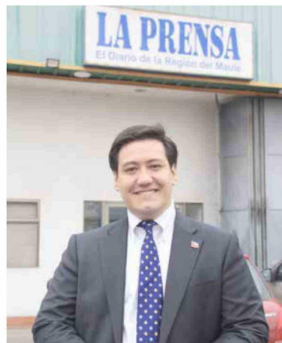
Sobre el inicio de un nuevo período de Gestión de Episodios Críticos señaló: "preocuparse de la calidad del aire es algo que es tarea de todos, no solamente de las autoridades al momento de fiscalizar".

"La idea es poder cambiarle la cara a la protección de la biodiversidad en Chile, en particular de esta región, que es muy rica en biodiversidad, especies y en paisajes, es una región muy linda, por tanto, tiene el potencial de transformarse en un polo de atracción turística, con un turismo verde".