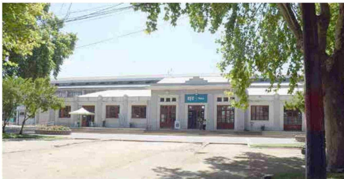
Esta es la fachada de la Estación de Trenes de Talca, que se encuentra en el centro de la capital regional, cuyo servicio de pasajeros fue inaugurado en 1875.

Tiraje: 4.200 Lectoría: 12.600 Favorabilidad: No Definida