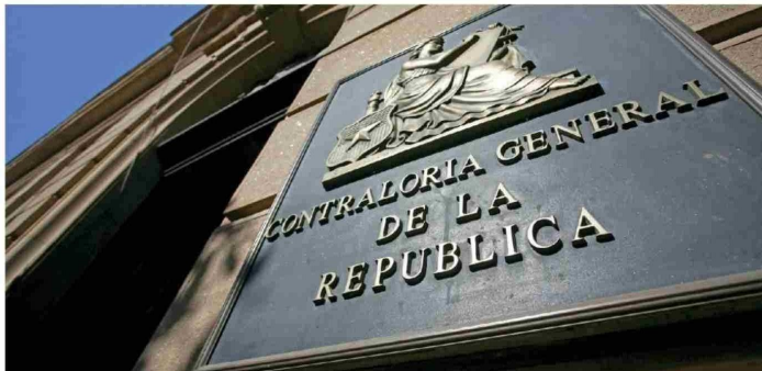
LA FUNDACIÓN VANGUARDISTA Divergente cuestionó la legalidad del Oficio N°3818-2026, que solicita RUN, nombres y datos clínicos de pacientes trans.