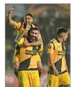
Copa Libertadores: Coquimbo remonta, derrota por 2-1 a Universitario de Perú y alcanza al puntero de su grupo. DEPORTES 1

Imputado por disparo de UZI durante encerrona en Providencia ya era indagado como miembro de una célula del Tren de Aragua C 8