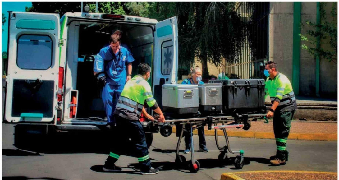
EN LO QUE VA DE 2026, EL COMPLEJO ASISTENCIAL angelino ha concretado tres procuramientos, cifra que aún mantiene al hospital bajo la meta proyectada.

Más de 2.250 personas permanecen en lista de espera por un órgano en Chile. En la provincia de Biobío, el hospital angelino alcanzó seis procuramientos en 2024, aunque durante 2025 no logró concretar ninguno debido, principalmente, a negativas familiares.