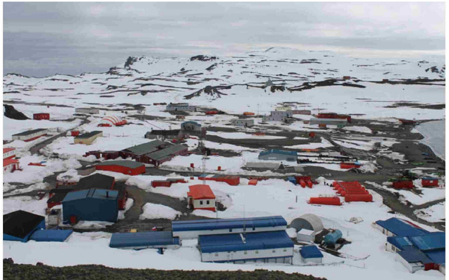
La comisión solicitó una serie de medidas tendientes a resguardar la soberanía nacional en la Antártica.

A ello se suma el crecimiento demográfico global y la creciente demanda de recursos estratégicos, escenario que —según planteó