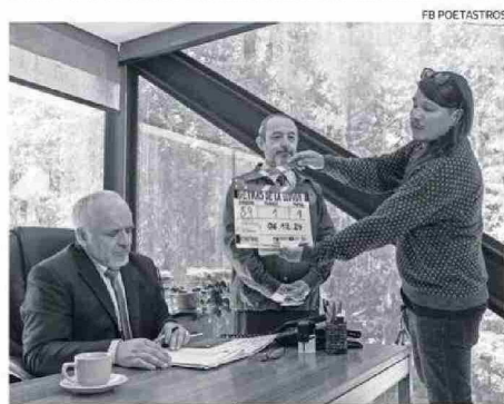
RODAJE DE LA PELÍCULA "DETRÁS DE LA LLUVIA".