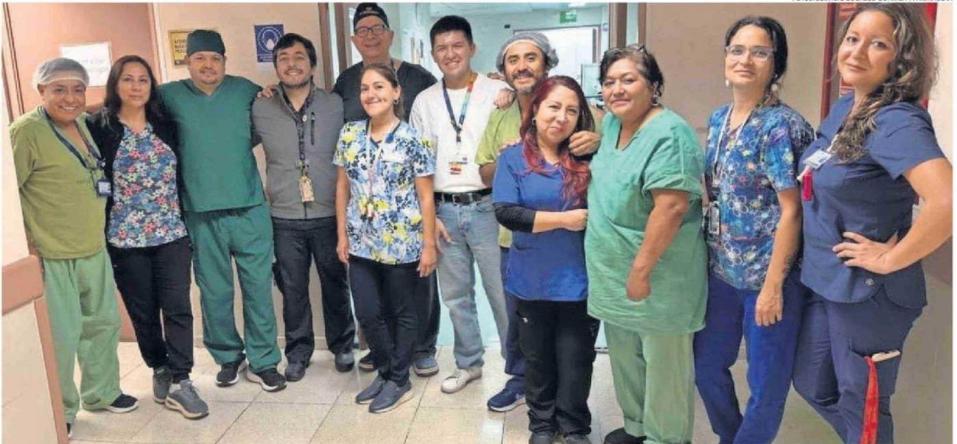
EL EQUIPO MÉDICO Y PARAMÉDICO INVOLUCRADO EN EL PROCEDIMIENTO HISTÓRICO EJECUTADO EN EL HOSPITAL REGIONAL DR JUAN NOÉ CREVANI.