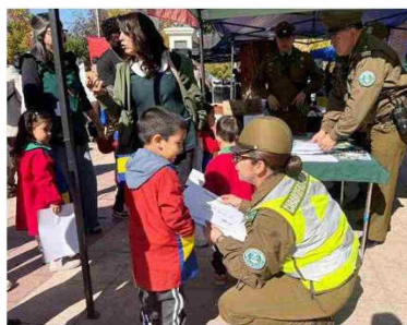
El MICC no solo busca reducir cifras delictuales; apunta a algo más profundo: recuperar el sentido de comunidad.