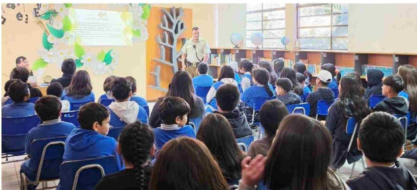
Los colegios también son visitados por los funcionarios de Carabineros donde exponen charlas y aclaran dudas.