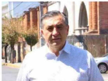
Por Bernardo Zapata Abarca Abogado

Así la toma del Morro, también conocida como la batalla de Arica, fue un acto decisivo en la guerra del Pacífico, y siempre será recordada como un acto de heroísmo cuyo legado quedó grabado a perpetuidad en nuestra historia chilena. Fundamentado en ello, se celebra también el Día del Arma de Infantería.