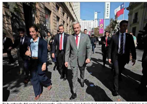
En la antecámara del envío del proyecto, el Presidente José Antonio Kast caminó ayer de regreso al Palacio de la Moneda, tras sostener una reunión con el titular del MOP, Martín Arrau, en la sede de la carter.

El Presidente Kast llamó al Congreso a actuar con "diligencia" y "prontitud". La Moneda descarta diferencias en el gabinete por las distintas fechas que la dupla Alvarado-García y Quiroz han dado para el despacho de la iniciativa.