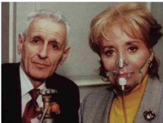
El 11 de marzo de 1993, la periodista Barbara Walters posa con el Dr. Kevorkian y un dispositivo similar al que usaba para su método de eutanasia.