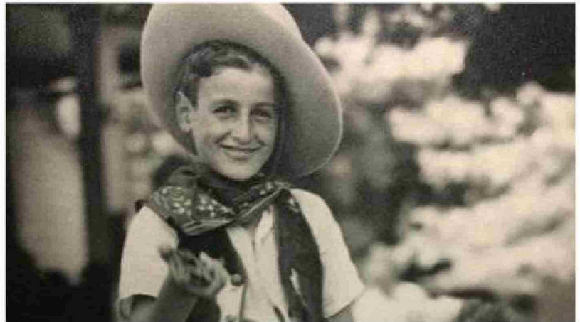
Jacobo "Jack" Kevorkian nació el 26 de mayo de 1928 en Pontiac, Michigan.

Hoy, el debate sigue siendo complicado y, en algunos casos, las leyes han cambiado, permitiendo que algunas personas que sufren enfermedades terminales elijan su destino con la ayuda de profesionales. Sin embargo, la figura de Jack Kevorkian sigue siendo objeto de controversia y reflexión. ¿Era un héroe o un asesino? La respuesta no es sencilla, y el tiempo será el que determine si su visión cambió el mundo o simplemente dejó una sombra de oscuridad en la