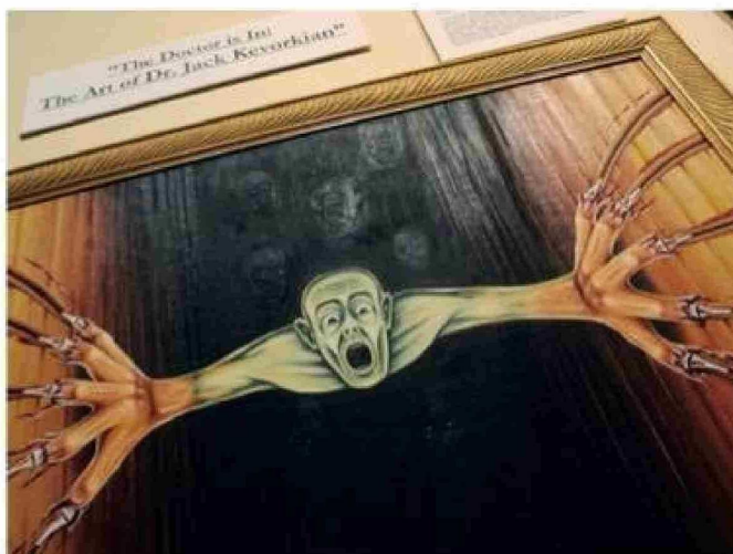
"Más cerca que tú que Dios", uno de los cuadros de Kevorkian.