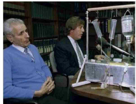
Kevorkian en una audiencia junto a su máquina, que ayudaba a morir.