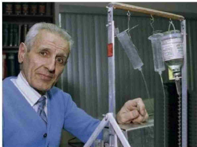
El "Doctor Muerte" creó la máquina del suicidio para pacientes terminales.

Tiraje: 5.200 Lectoría: 15.600 Favorabilidad: No Definida