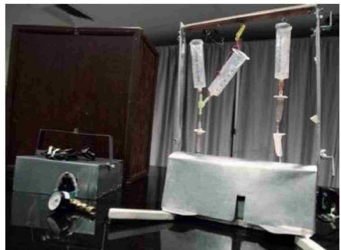
La máquina de la muerte, el Thanatron que ideó Kevorkian.