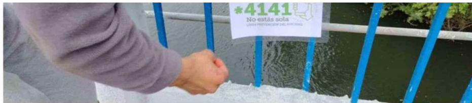
ALUMNOS HAN INSTALADO MENSAJES DE PREVENCIÓN DEL SUICIDIO EN LOS PUENTES DE LA CIUDAD.

"Por lo tanto, si se ha detectado ese nivel de presencia en adolescentes de primer año