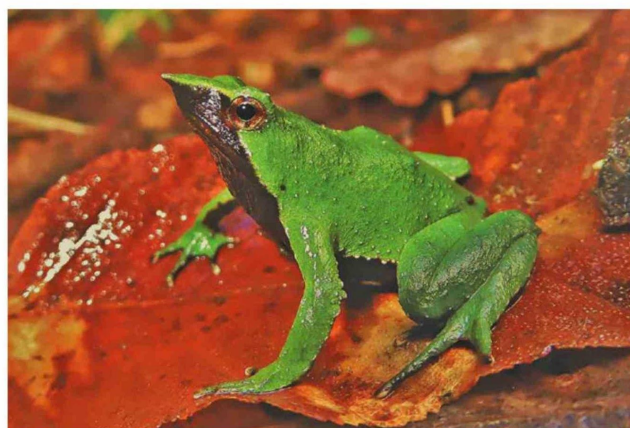
Ranita de Darwin (Rhinderma darwini).