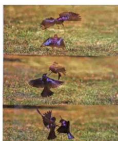
Mirlos (Molothrus bonariensis).