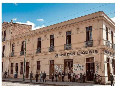
EN UN MOMENTO DE SU HISTORIA, EN VALPARAÍSO HUBO MÁS DE UN MILLAR DE EMPORIOS, CUYOS PROPIETARIOS ERAN ITALIANOS.

-Me atrevería a decir que los italianos revolucionaron por completo el día a día del puerto a través del comercio minorista. Como no manejan grandes capitales de inversión de los británicos o alemanes, se la jugaron por abrir pequeños almacenes