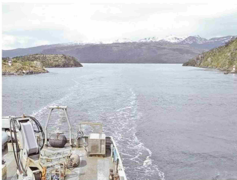
El paso Kirke forma parte del acceso marítimo a Puerto Natales.

Los sectores periurbanos de la capital provincial se podrían