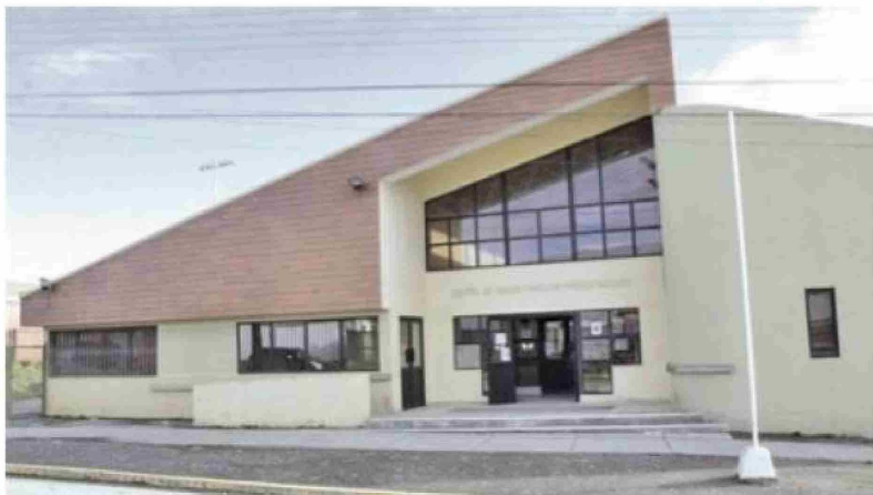
La reposición del Cesfam Juan Lozic está incluida en la cartera de proyectos del Plan de Desarrollo de Zonas Extremas.

Avenida Pedro Montt se destinarían $1 mil 073 millones. Las faenas comenzarían el próximo año. Las calles de la capital del turismo también se verían beneficiadas con el plan de conservación de vías urbanas, con el cual se analizará el estado de las vías y se planificará un programa para su repavimentación. Este se haría el próximo año con un costo de $500 millones.