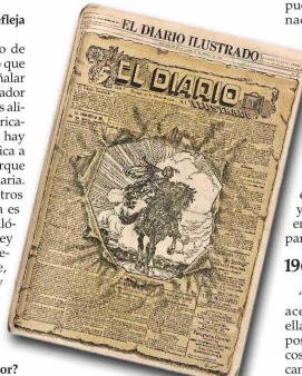
Celebración de los 50 años del Diario Ilustrado, con una portada especial.

hacia el mundo de las ideas, que se refleja en los discursos de Kast? "Bueno, entiendo que el campo de discusión de Peña es otro. Pero creo que hay cierto prejuicio analítico al señalar que el ambiente intelectual conservador es un campo vacío, de eso nos hemos alimentado por décadas."