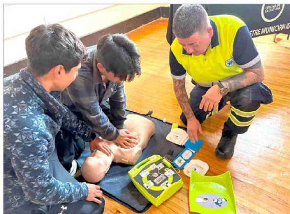
La jornada se desarrolló en el Centro Cultural Agustín Ross y abordó la cadena de supervivencia adulto extrahospitalaria.