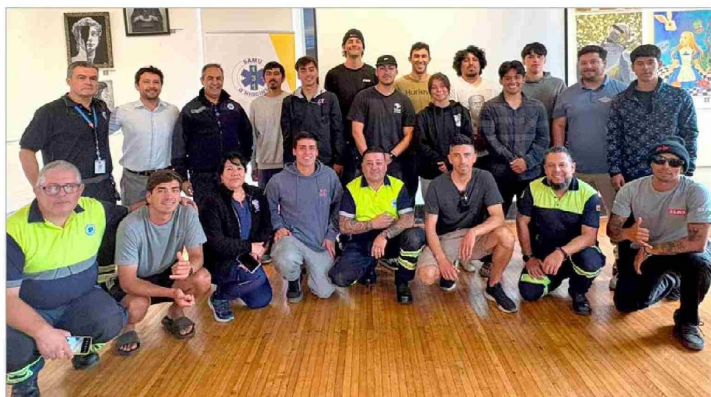
Más de 15 rescatistas municipales fortalecieron sus conocimientos en primeros auxilios.

Más de 15 rescatistas municipales fortalecieron sus conocimientos en RCP, uso de DEA y atención de asfixias, en una jornada certificada por dos años