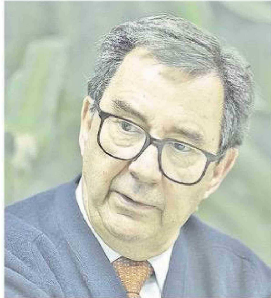
El ministro de Defensa, Fernando Barros Tocornal.

Pero la conversación abarcó mucho más. Barros adelantó que el Presidente Kast dio su visto bueno para realizar el primer Consejo de Gabinete en pleno en la Antártica Chilena durante la próxima temporada estival. Entregó su lectura sobre la presencia china en el continente blanco, el incidente del buque activista que embistió pesqueros no-