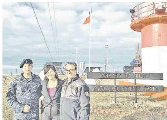
A la izquierda, el ministro Barros a bordo del rompnieve Viel. A la derecha, visitando a la dotación del Faro Espíritu Santo, en el punto donde confluyen los océanos Pacífico y Atlántico.