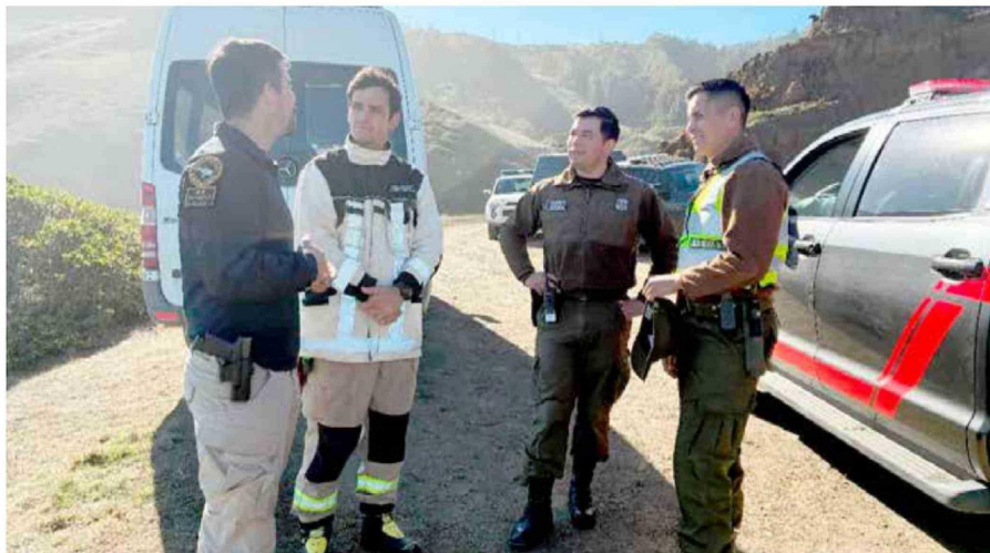
Organismos de emergencia sigue en terreno en búsqueda de la persona extraviada.

No hay que olvidar que en el accidente perdieron la vida dos pescadores y un tercero sobrevivió tras nadar a la orilla y alertar de la tragedia.