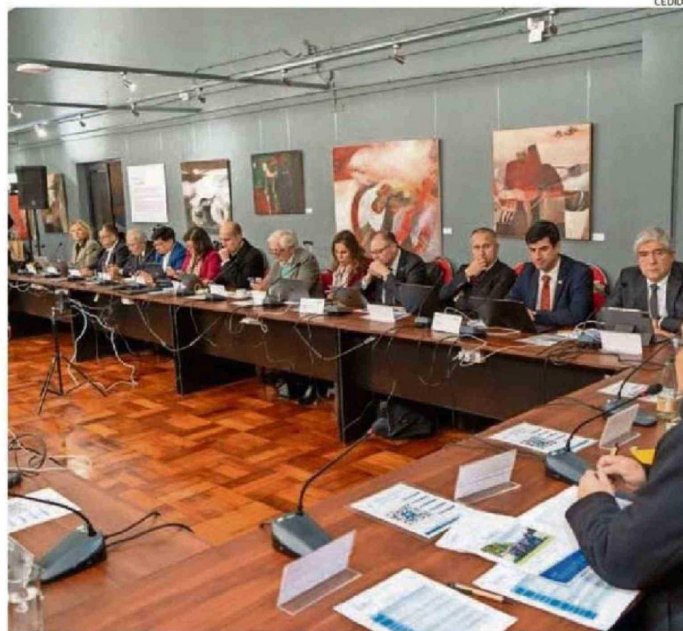
SE DESARROLLÓ LA SESIÓN 671 EN LA UNIVERSIDAD DEL BÍO BÍO.

ENCUENTRO. La sesión 671 del Cruch se desarrolló por vez inédita en Chillán, poniendo énfasis en rol descentralizador de la UBB, casa anfitriona.