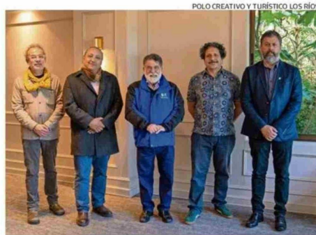
AUTORIDADES DE LOS RÍOS Y LA UACH EN EL CIERRE DEL PROYECTO.