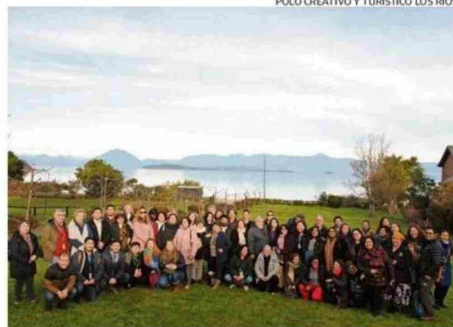
LA INICIATIVA FUE FINANCIADA POR EL GOBIERNO REGIONAL.