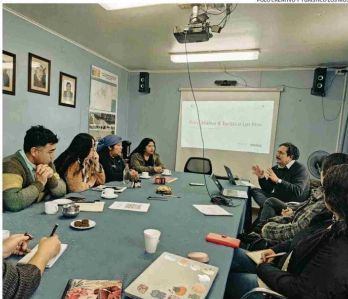
DURANTE EL PROYECTO SE TRABAJÓ EN COMUNAS Y CON DISTINTOS ACTORES RELEVANTES.

y emprendedores del mundo rural, creativo, turístico e institucional fueron parte de los diálogos; y algunos incluso accedieron a instancias de perfeccionamiento y mercado.