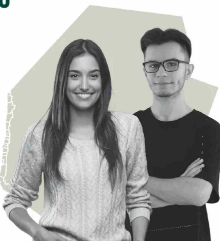
SANTO TOMÁS LA RED TRANSFORMADORA DE CHILE