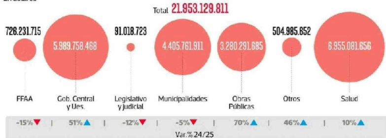
Transacciones por sector En dólares