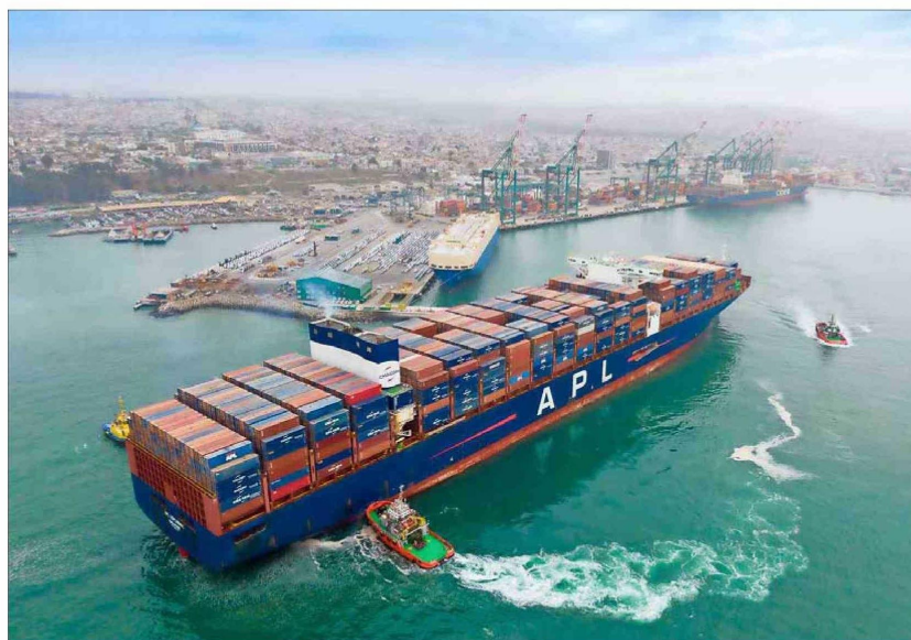
Del total de 2.060.244 teus movinizados en 2025, el 59% correspondió al terminal operado por el concesionario STI y el 41% a DP World, dijo EPSA.

En la estatal EPSA estiman que podría alcanzar su nivel máximo en 2033 o 2034. En tanto, el megapuerto proyectado para la zona partiría recién su primera fase de operación en 2036. La firma enfatiza la necesidad de avanzar con esa obra.