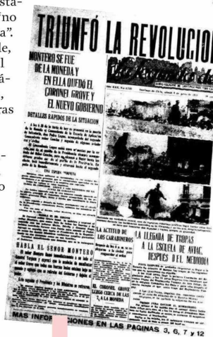
El 4 de junio de 1932 terminó el Gobierno. Así informó La Segunda los hechos.

serio en el ejercicio del poder, eso no era claramente una virtud en los tiempos que corrían, más si se comparaba con figuras de otras características, como Alessandri y el propio Ibáñez; asimismo, el nuevo papel creciente del Estado, interventor y socializante, también tenía detractores.