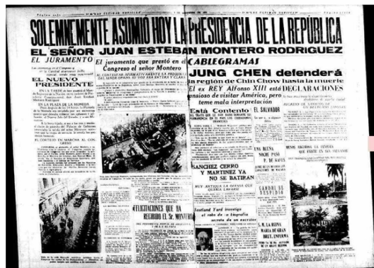
El mismo día en que asumió el nuevo Presidente, La Segunda ya desplegaba información sobre la novedad.

Esto ocurría apenas un mes y medio antes de que su gobierno fuera derrocado por un golpe de Estado. En la práctica, la labor opositora se agudizó, mientras los apoyos al gobierno fueron descendiendo de una forma clara. Si bien Montero era un hombre