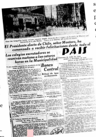
Así informó La Segunda el 5 de octubre de 1931 el triunfo de Montero.