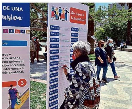
PORTEÑOS Y PORTEÑAS PARTICIPARON EN LA INSTANCIA.

Iniciativa del Serviu recogió opiniones de porteños para considerar en la intervención, que contempla una renovación total de veredas y mobiliario urbano. En tanto, las obras de la plaza Victoria se siguen estirando.