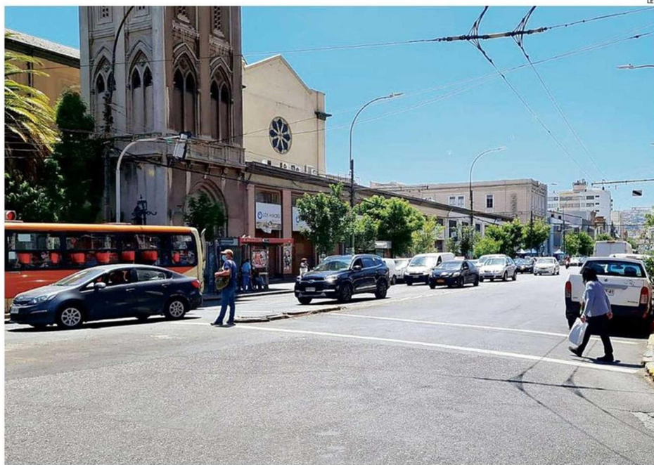
LA INTERVENCIÓN SE CENTRará EN MEJORAR LA ACCESIBILIDAD DEL TRáNSITO PEATONAL.

Desde Serviu señalan que el proceso ha contado con la participación de todos los actores sociales que transitan o trabajan en la arteria, como vecinos, comerciantes locales, organizaciones de personas no videntes, de movilidad reducida, también instituciones de educación superior, establecimientos educacionales, colegio de arquitectos, entre otros, que han aportado desde su experiencia con ideas e inquietudes. Siguiendo ese tenor, ayer en la plaza Victoria se dispuso de un puesto informativo para dar a conocer la iniciativa, y al mismo tiempo que los vecinos y vecinas pudieran plasmar sus inquietudes y necesidades para el proyecto de remodelación de las veredas. Para esto, había un panel donde la gente podía escribir los puntos que, a su juicio, se deben priorizar en el proyecto. Este punto físico solo estuvo disponible por el día lunes, pero mediante el sitio web www.pedromonttinclusivo.cl se puede revisar mayor información del plan.