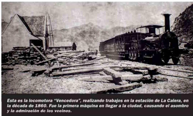
Esta es la locomotora "Vencedora", realizando trabajos en la estación de La Calera, en la década de 1860. Fue la primera máquina en llegar a la ciudad, causando el asombro y la admiración de los vecinos.

La nueva república de Chile comenzó a organizarse administrativamente en todo su territorio, razón por la cual el 30 de agosto de 1826, el país fue dividido en 8 provincias. Una de esas provincias fue la de Aconca-