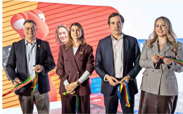
Con el corte de cinta se inauguró la nueva Sucursal Preferencial Kennedy de Bci.

"Esta sucursal no es solo un espacio físico remodelado, sino