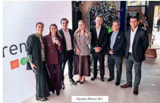
Equipo Banco Bci.

eficiente y con mayor privacidad. La zona de asesoría ubica a los ejecutivos frente a los clientes, sin barreras físicas, mientras que las cajas fueron reorganizadas para reforzar la privacidad y seguridad de las distintas operaciones.