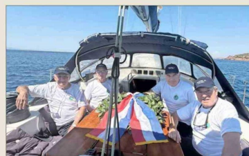
Excadetes de la Escuela Naval lanzaron una ofrenda floral en el mar Egeo, frente al templo de Poseidón, en las costas de Grecia.

En Grecia, en tanto, veinte miembros de la generación "Motes 73" de la Escuela Naval (denominación que reciben los cadetes de primer año),