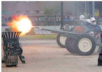
SANTIAGO — En la capital, la ceremonia incluyó disparos de salvas de cañón para recordar el momento en que la "Esmeralda" quedó sumergida en la rada norteña.