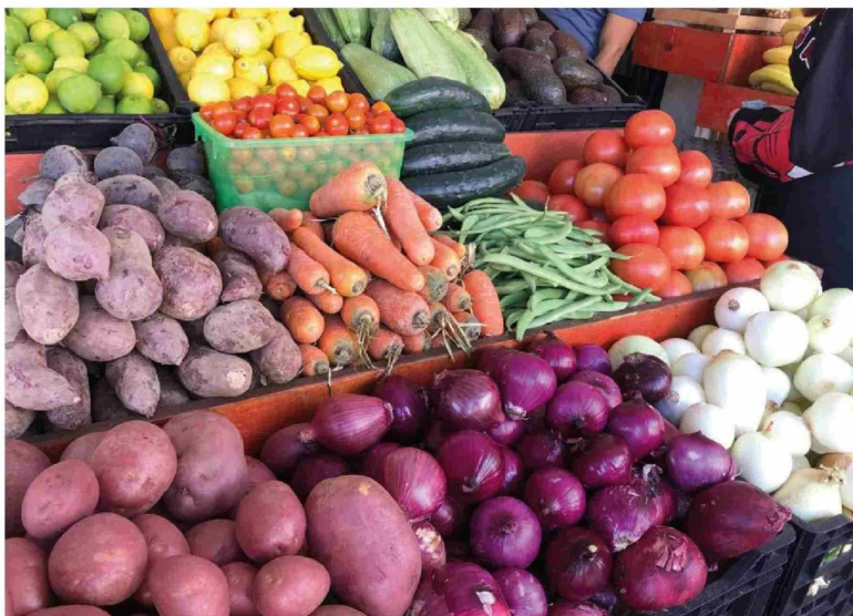
CON LA LLEGADA DEL INVIERNO, se espera contar con hortalizas en calidad y cantidad para la temporada, para que los productores requieran de frío y precipitaciones.

Sobre el Fenómeno de La Niña, que genera inviernos más secos y temperaturas bajas, Muñoz consideró que "no ha ocurrido como se pensaba, lo cual es bueno". El representante proyectó que en