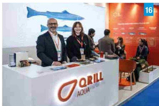
Foto 16: Orill Aqua participó con un stand enfocado en la interacción con asistentes.