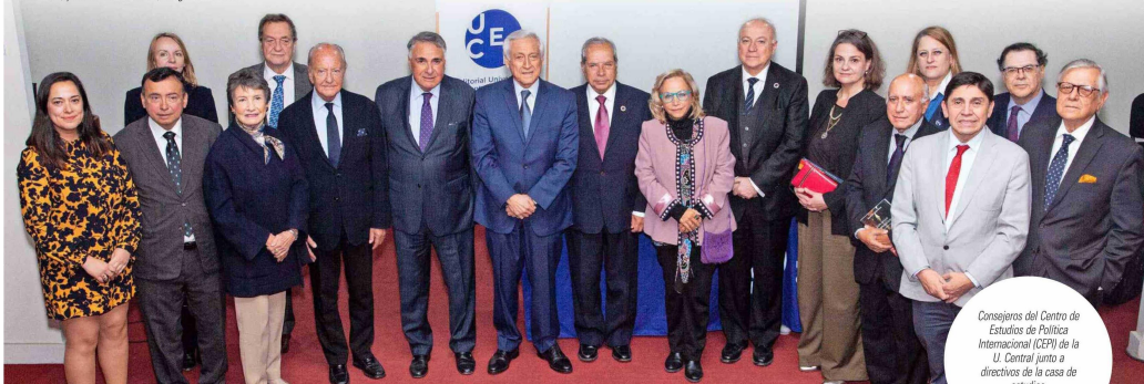
Consejeros del Centro de Estudios de Política Internacional (CEPI) de la U. Central junto a directivos de la casa de estudios.