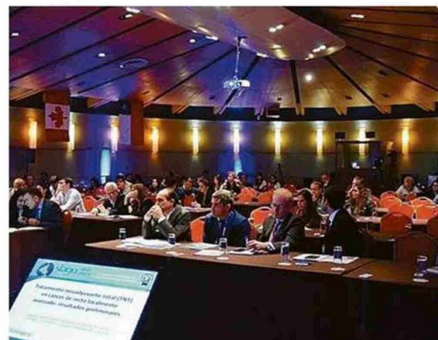
CONGRESO SLAGO TUVO LUGAR EN EL HOTEL ENJOY DE VIÑA.