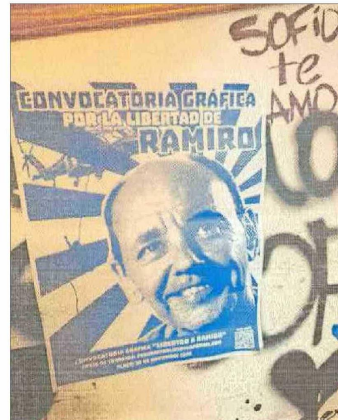
Afiches recuperados en domicilios de estudiantes en apoyo a libertad de exfrentista.