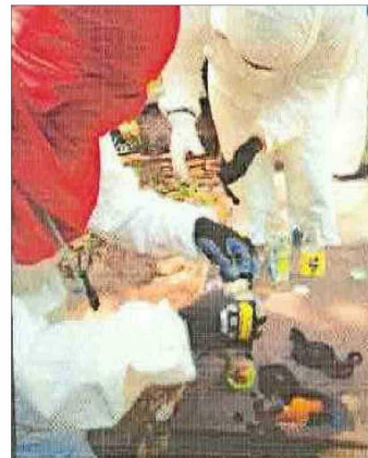
Imputados guardaban en teléfonos evidencias de molotov que sirvieron de pruebas en su contra.