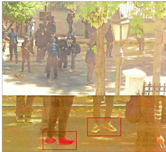
Debido a que los imputados actúan encapuchados, el OS9 de Carabineros estableció la participación de alumnos del INBA, comparando zapatillas y vestimentas usadas en delitos.

El OS9 analizó los registros e informó a la fiscalía que "en las paredes del dormitorio se ob-