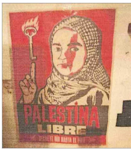
La causa pro Palestina también está entre las materias de interés de imputados, según investigaciones.

serva abundante iconografía y simbología de carácter ideológico, destacando símbolos anarquistas, incluyendo la 'A' pintada o dibujada en muros. Estrella del caos, pintada o dibujada en muros".