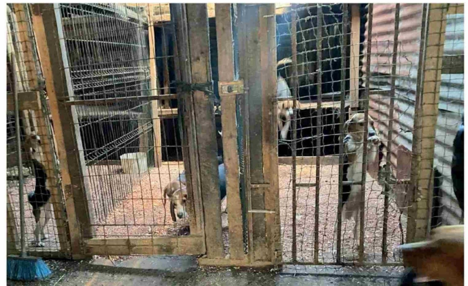
EN EL LUGAR NO SOLO FUNCIONABA un canil clandestino intervenido, sino también un criadero ilegal que no pudo ser allanado por falta de orden judicial, donde aún permanecerían más animales en condiciones similares, incluidos perros de raza.

Tras el rescate, los caninos recibieron tratamiento