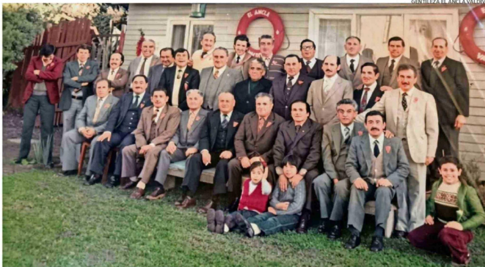
LOS FUNDADORES DEL CÍRCULO DEL PERSONAL EN RETIRO DE LA ARMADA NACIONAL "EL ANCLA" DE VALDIVIA, SE REUNIERON EL 21 DE MAYO DE 1976.

PARTICIPACIÓN. Actualmente la institución cuenta con 45 socios y hoy su directiva depositará una ofrenda floral en la ceremonia de homenaje a los héroes de Iquique.