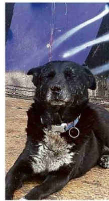
QUERIDO PERRO BLACK.

"En Valparaíso estamos enfrentando de forma seria el problema. Desde julio se han emitido 13 oficios para exigir que los propietarios se hagan cargo de sus propiedades con limpieza, cierres y mantenimiento. Es necesario buscar un protocolo que agilice el trabajo del municipio, especialmente de la Dirección de Obras Municipales, para tener mayor celeridad y actuar de manera