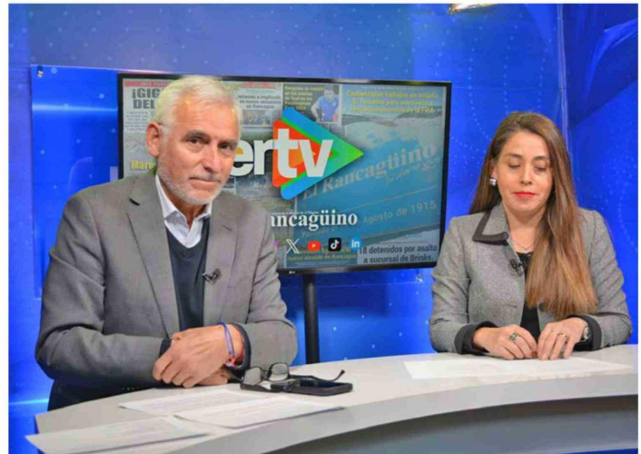
Durante la entrevista, la autoridad regional detalló avances en proyectos emblemáticos como pórticos de televigilancia, luminarias, estaciones ferroviarias y apoyo a Teletón O'Higgins.

Silva recordó que la experiencia de los incendios forestales de 2017 marcó un punto de inflexión "Ahí vimos las condiciones en que estaban los bomberos