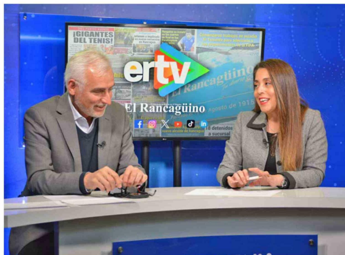
Seguridad pública y fortalecimiento comunitario marcaron parte de la conversación con el Gobernador Pablo Silva, donde el gobernador explicó el impacto de los proyectos del 8% en barrios de la región.

CON FOCO EN SEGURIDAD PÚBLICA, CONECTIVIDAD, SALUD E INVERSIÓN SOCIAL, EL GOBERNADOR REGIONAL DE O'HIGGINS, PABLO SILVA AMAYA, REPASÓ LOS PRINCIPALES PROYECTOS QUE HOY IMPULSA EL GOBIERNO REGIONAL: CASI 400 INICIATIVAS DEL 8% DE SEGURIDAD, LUMINARIAS EN PICHILEMU, PÓRTICOS CON TELEVIGILANCIA, NUEVAS ESTACIONES DE TRENES, APOYO A TELETÓN Y UNA HISTÓRICA INVERSIÓN EN BOMBEROS.