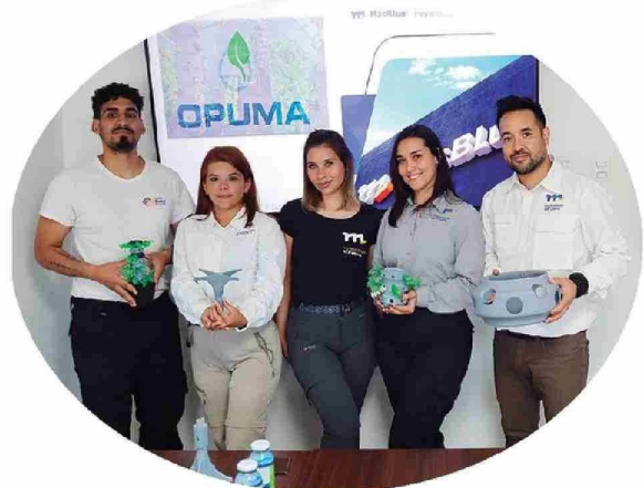
Proyecto Opuma de la línea Innova Región desarrollado por Más Blue.