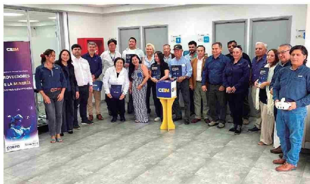
Beneficiarios de Programa de Difusión Tecnológica (PDT) "Proveedores de la Minería: Corfo y CEIM".