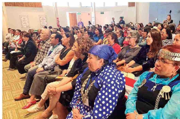
Beneficiarias del Programa Viraliza Eventos en Congreso Intercultural