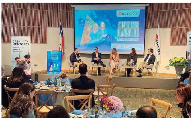
Programa Viraliza Formación "Crea Mentores" de Corfo e Inacap.