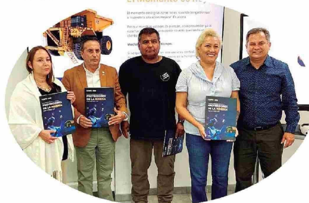
Certificación beneficiarios de Programa de Difusión Tecnológica (PDT) "Proveedores de la Minería: Corfo y CEIM"