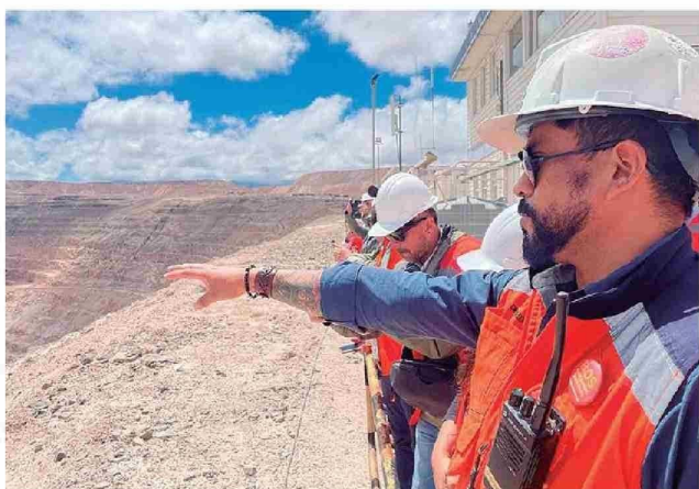
Programa de Difusión Tecnológica (PDT) "Proveedores de la Minería: Corfo y CEIM".

En 2026 apoyará a mil 266 beneficiarios en 256 proyectos.