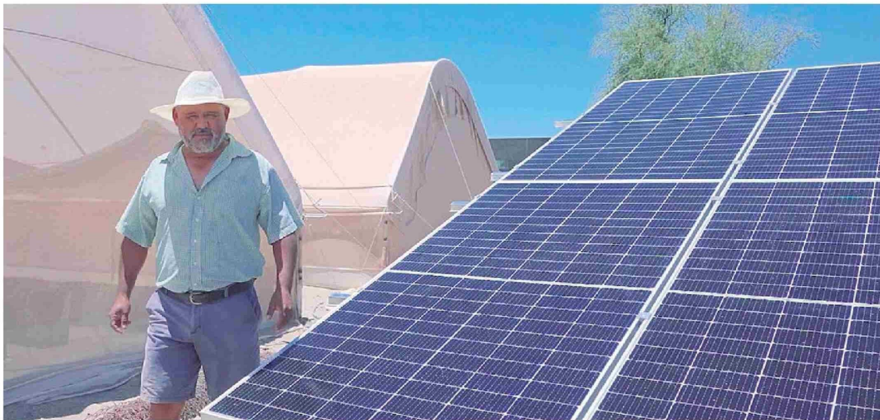
Programas (PAR) de apoyo a Pymes en energías renovables

Corporación estatal en Tarapacá realizó balance al cumplirse el 87° aniversario de la institución de fomento.